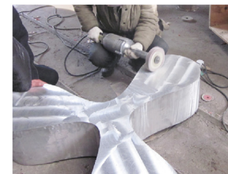
製作工程 2：アルミ鋳造／研磨の様子