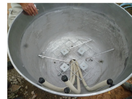
製作工程 1：プランターの固定やライトアップの電線