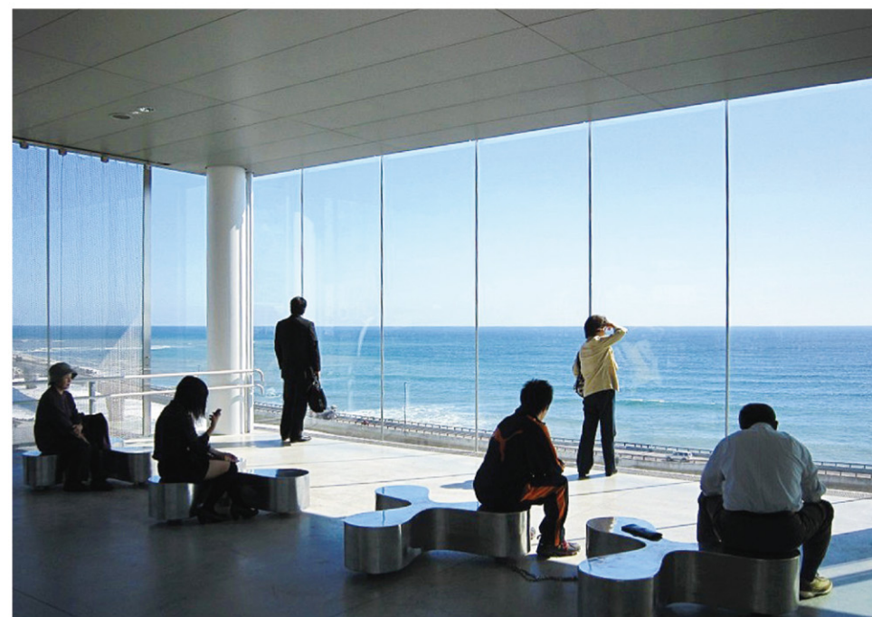
Yukikazeマイブログ「つれづれさいたま」より転用