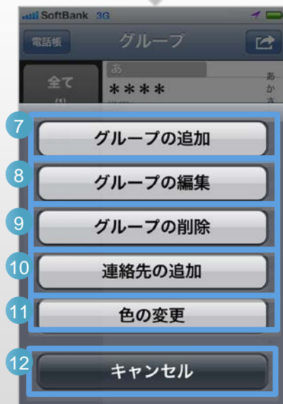
電話帳の設定メニュー