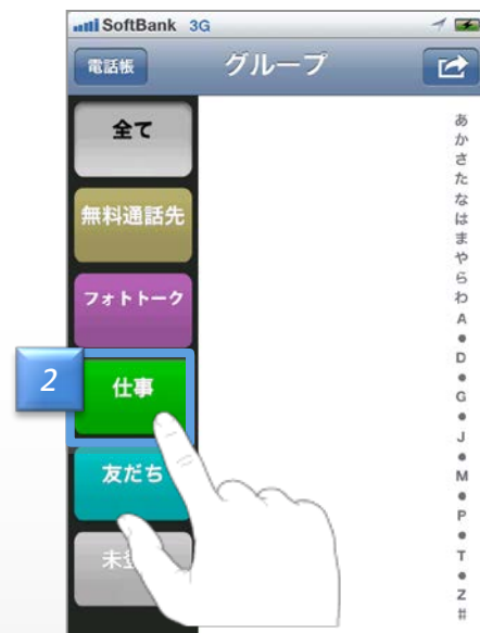
グループ一覧画面