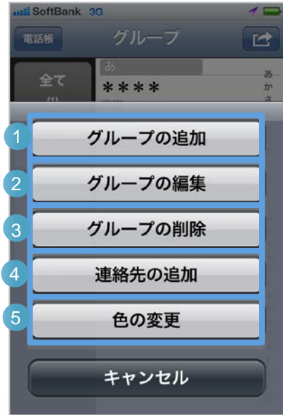
グループ一覧画面