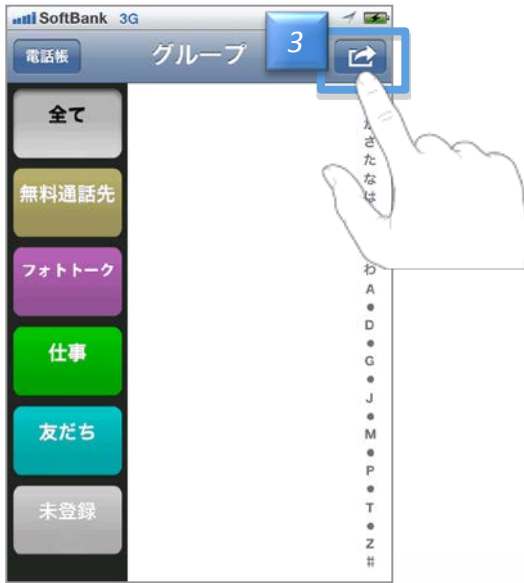
グループ一覧画面