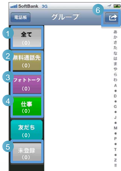
電話帳 (グループ一覧)画面

※グループ一覧画面では、すでに登録済の電話帳の一覧を表示したり、新たな電話帳を登録することができます