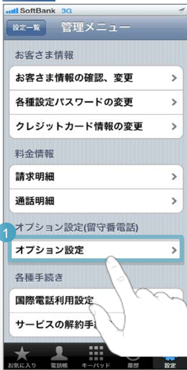
管理メニュー画面

管理メニューは「設定」→「管理メニュー」にて、管理メニューにログインすることで表示されます