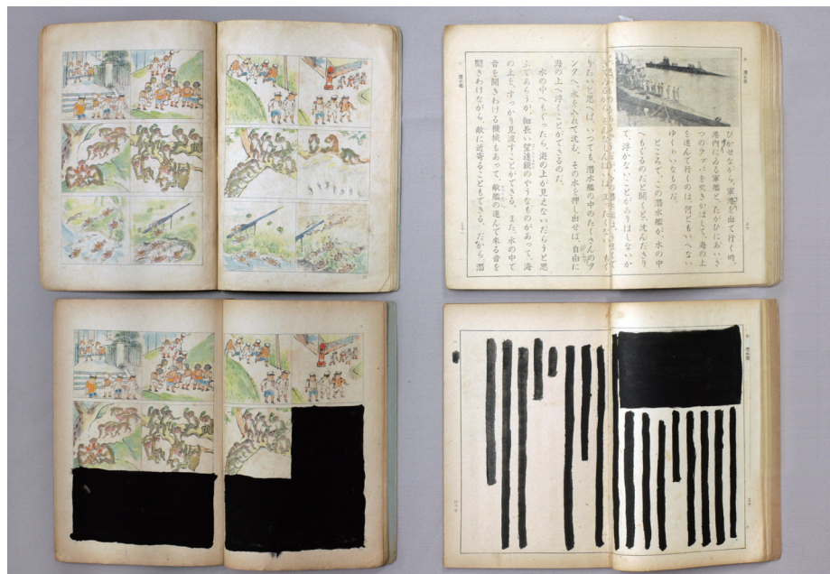
上段左「カズノホン」 (教科書文庫昭和16-11) 下段左「カズノホン」 (教科書文庫昭和16-10) 上段右「初等科国語二」 (教科書文庫昭和17-2) 下段右「初等科国語二」 (教科書文庫昭和17-3)