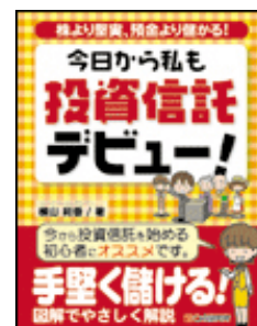
今日から私も投資信託デビュー！