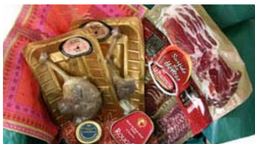
世界のグルメセット