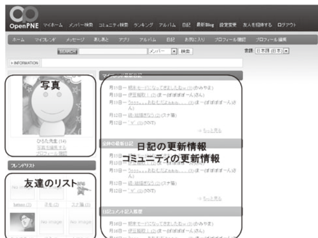
図1 マイホーム画面イメージ

OpenPNEの基本機能や画面デザインは初期設定のまま使用した。基本機能には「マイフレンド」「メッセージ」「あしあと」「アルバム」「日記」「お気に入り」「プロフィール管理」「プロフィール編集」の機能があり、既存のSNSサイトであるmixiやGREEとほぼ同等の機能が装備されていると考えられる。mixiとOpenPNEの機能を比較・対応させると、mixiの「つ