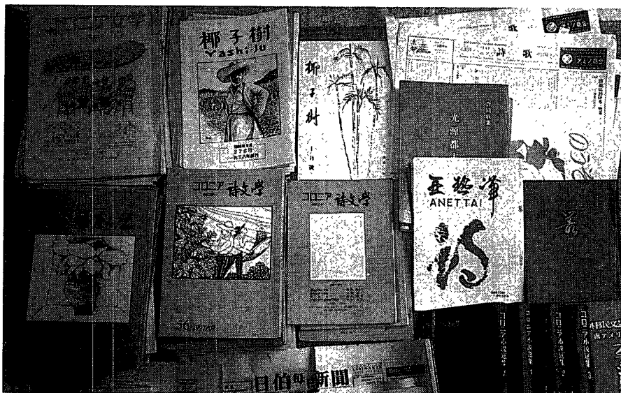
ブラジル日系人の発刊せる歌誌及び総合文芸雑誌類