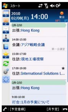
「サイボウズモバイル KUNAI for Windows® phone」画面