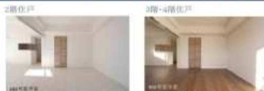
※フローリングは階数ごとに異なります。

【305号室】 賃料:183,000円 共益費:12,000円 1LDK・45.72㎡ 4/21立会予定