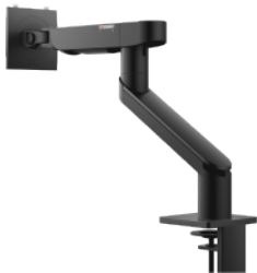
Dell シングル モニター アーム | MSA20

スイッチを切り替えるだけで左右の角度を調整できる世界初のモニター アーム 26 は、デスクをすっきりと片付けるのに最適で、組み立てと設置も簡単です。