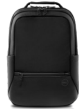
Dell Premier バックパック 15 | PE1520P

50%リサイクル素材を使用しおしゃれでスタイリッシュなレザー スリーブがノートパソコンを保護します 24 。