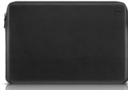
Dell EcoLoop レザー スリーブ14 | PD1422VL

50%リサイクル素材を使用しおしゃれでスタイリッシュなレザー スリーブがノートパソコンを保護します 24 。