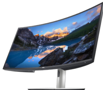
Dell デジタルハイエンドシリーズ U3821DW 37.5インチワイド曲面USB-C HUB モニター

スイッチを切り替えるだけで左右の角度を調整できる世界初のモニター アーム 26 は、デスクをすっきりと片付けるのに最適で、組み立てと設置も簡単です。