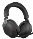
Jabra Evolve2 85

3台のデバイスでシームレスにマルチタスクを実行できるプレミアムなフル サイズのキーボードと、スッキリしたデザインのマウスの組み合わせです。プログラム可能なショートカットを搭載、バッテリーは36か月持続します 27 。