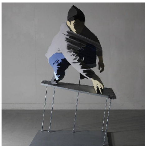
茂木淳史『cloud#3』2022 ミクストメディア 160x110x70cm ©MOGI Atsushi