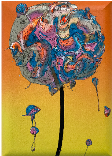
奥田雄太『Abstract Single Flower (Yellow Gradation x Turquoise Blue)』 2022 アクリル絵具、顔料インク、キャンバス 33.3x24.2cm ©OKUDA Yuta

新しい年を見据えて、今後益々の活躍が期待される6名の作家、それぞれの世界観（Features）をぜひこの機会にお楽しみいただければ幸いです。