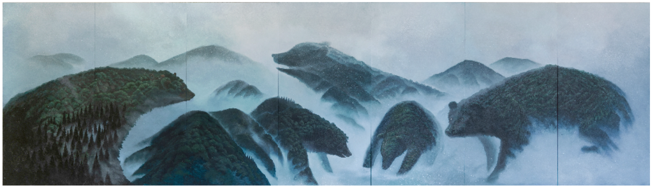
永沢碧衣『山影を纏う者』2021 パネルにキャンバス、ジェッソ、胡粉、水干絵具、墨、アクリルガッシュ、岩絵具 182x637cm ©NAGASAWA Aoi

ギャラリー桜林は2022年10月16日（日）より、奥田雄太、熊澤未来子、古西穂波、永沢碧衣、水野里奈、茂木淳史によるグループ展「Features」を開催致します。