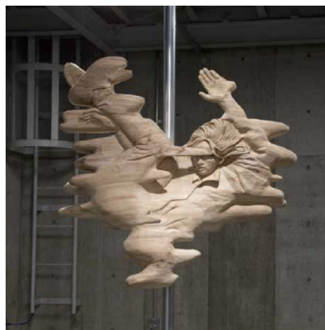
古西穂波『surface of water』2022 楠木、ミクストメディア サイズ可変 ©KONISHI Honami