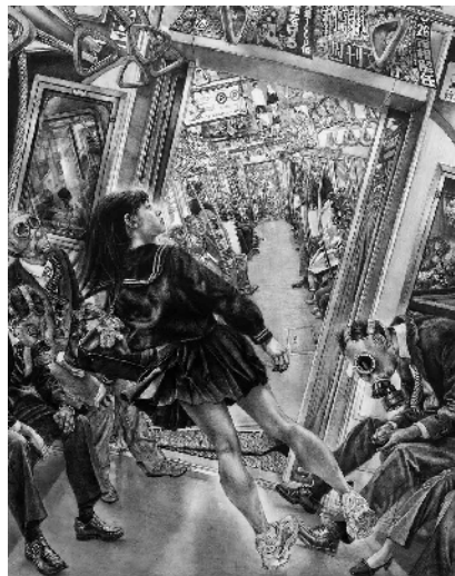
熊澤未来子『丸ノ内線』2022 パネル、ジェッソ、鉛筆 91x72.7cm ©KUMAZAWA Mikiko Courtesy Mizuma Art Gallery