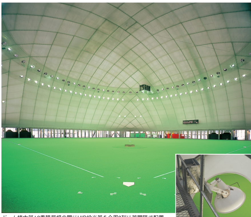
ドーム棟内部：2重膜屋根の間にHID投光器を全周2列に等間隔で配置

アスレチックジムの照明は、200W蛍光水銀ランプダウンライトを規則配置し、カーテンウォールからの外光との照度バランスを良好にした開放感のある照明環境を形成しています（平均照度450 lx）。