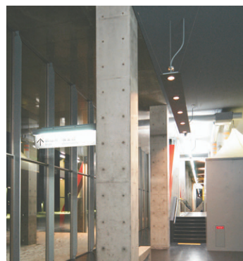
ドーム棟内部回廊の照明