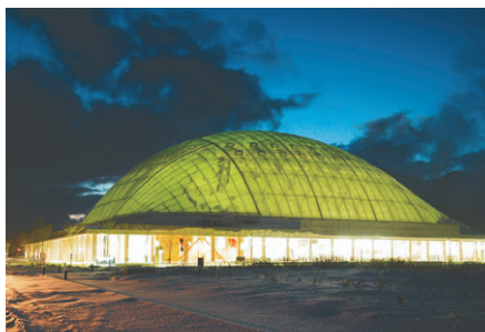
夜景：膜屋根からの透過光で形状を浮かき上らせている