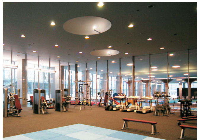
センターハウス棟アスレチックジムの照明(200W蛍光水銀ランプダウンライト)