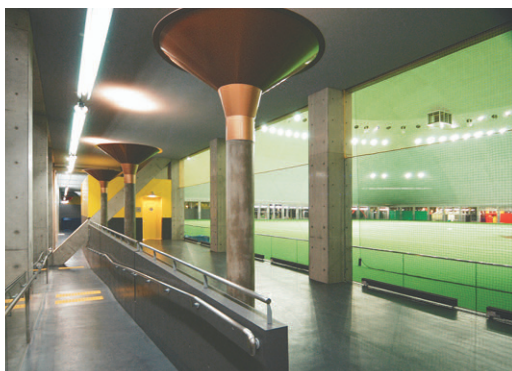
ドーム棟内部回廊の照明