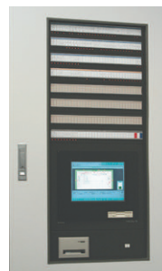
照明制御装置主操作盤