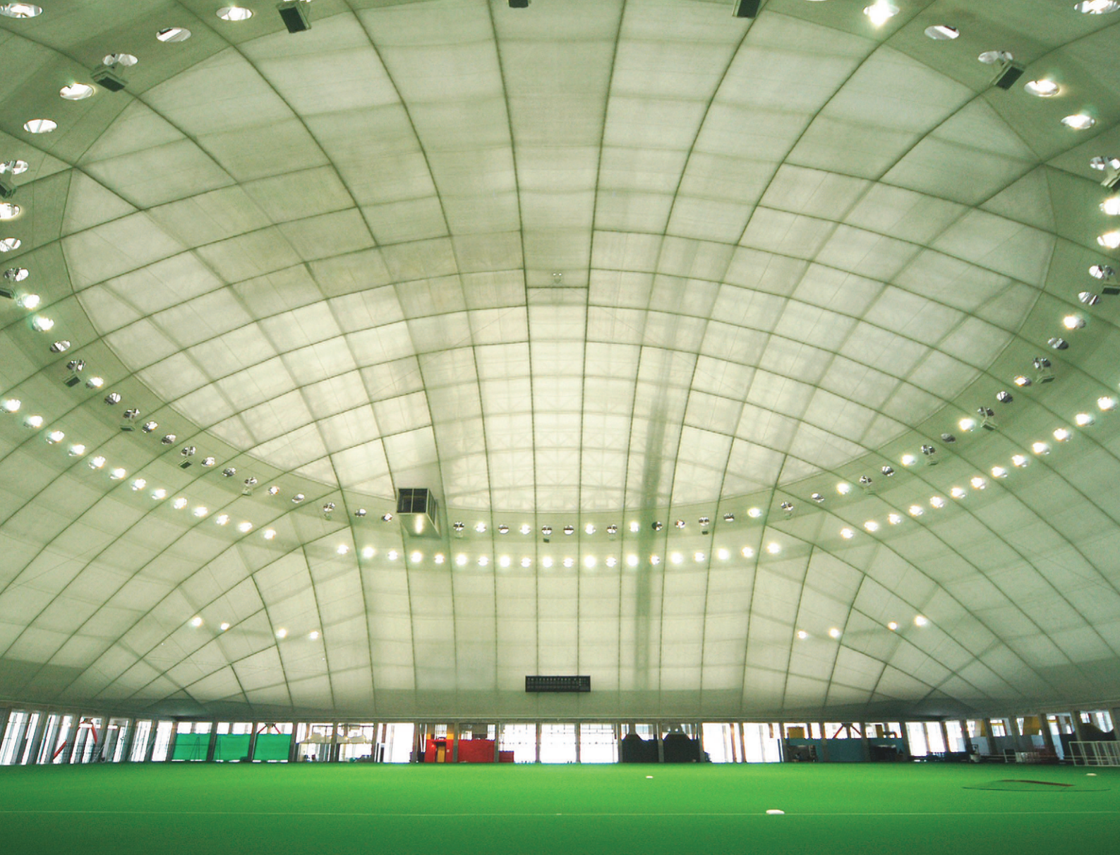
ドーム棟アリーナの照明：1kWメタルハライドランプ投光器124台を設置。各競技レベルに対応した11種類の点灯パターンを作成し、照明制御盤で操作