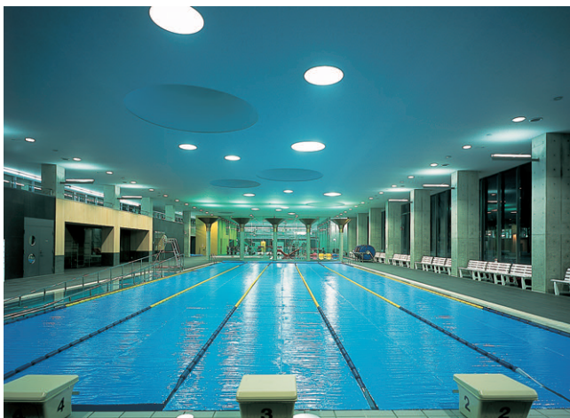
センターハウス棟プールの照明(100Wメタルハライドランプダウンライトと建築化照明)