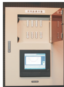
照明制御装置副操作盤