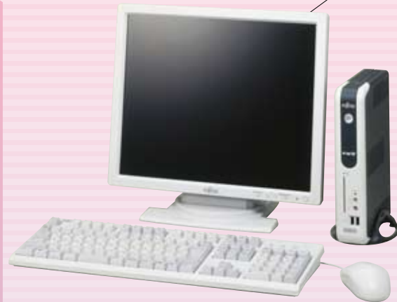
※ディスプレイ、キーボード、マウスは別売となります。