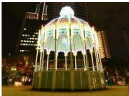
(カッサアルモニカ)