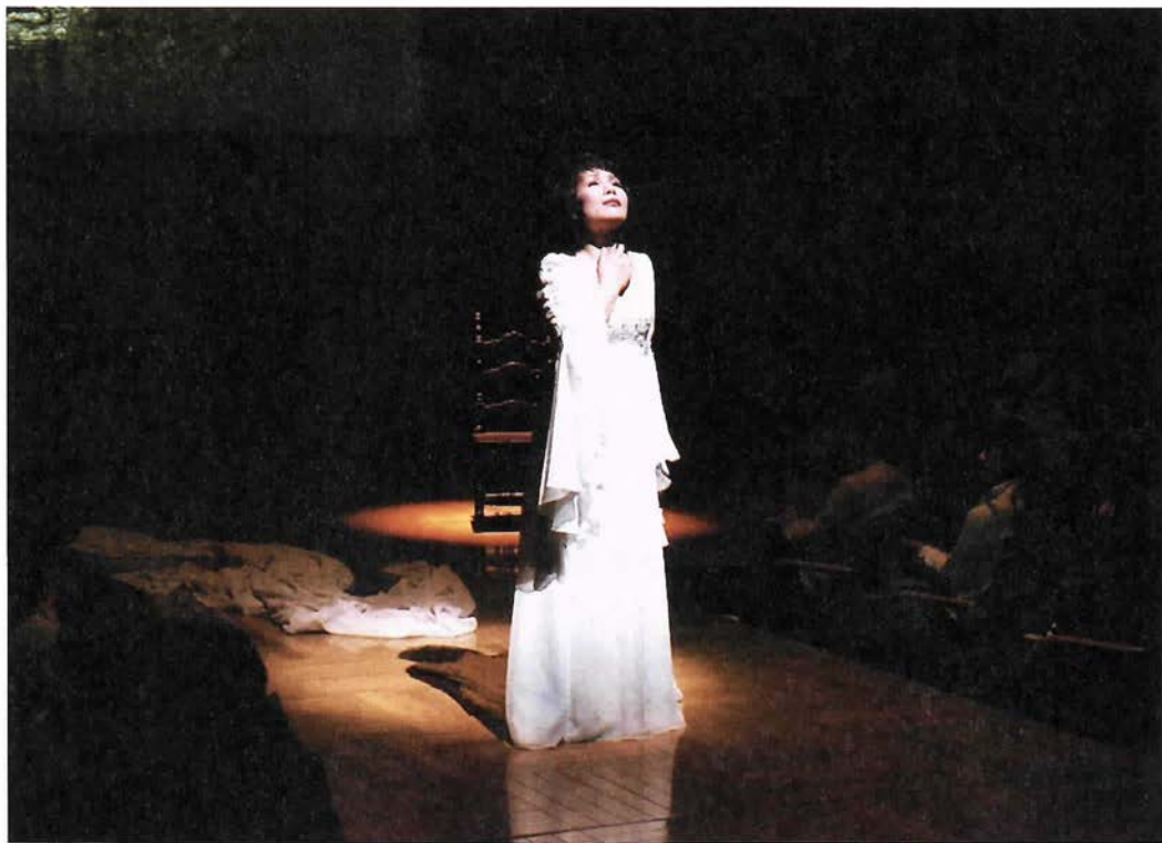
「ロメオとジュリエッタ」2006年2月15日 ザ・フェニックスホール より