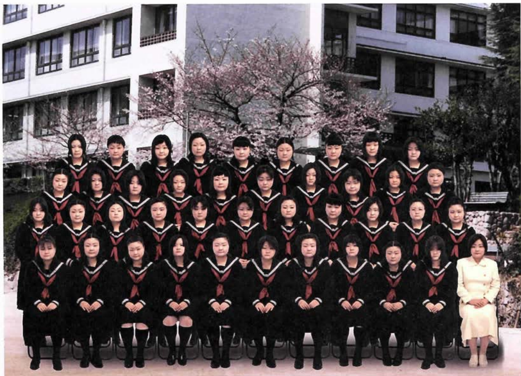
School Days/A (2004年)