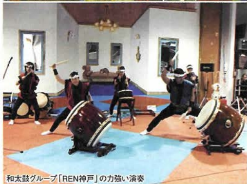
和太鼓グループ「REN神戸」の力強い演奏