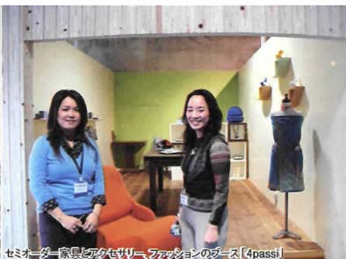
セミオーダー家具とアクセサリ、ファッションのブース【4pass!】