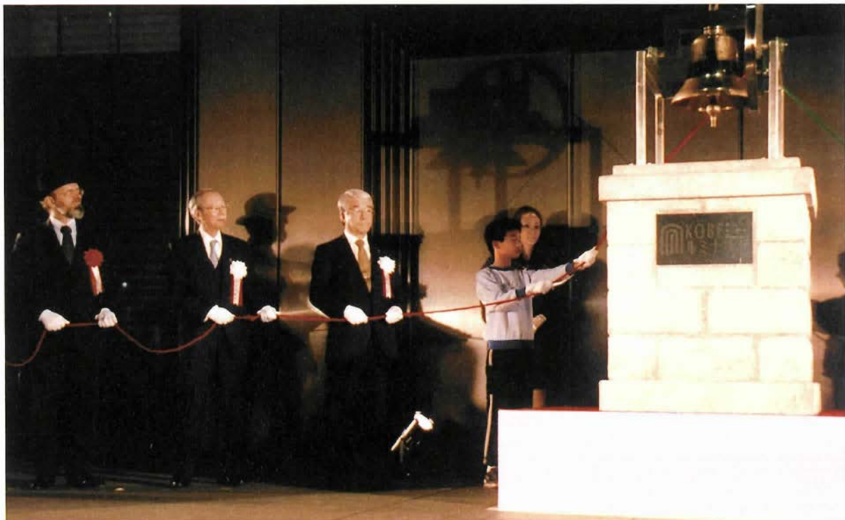
神戸ルミナリエ点灯式にて