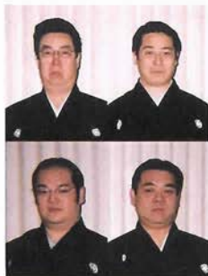
上田兄弟会 (能楽師)