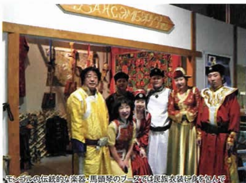
モシールの伝統的な楽器・馬頭琴のブースでは民族衣装に身を包んで