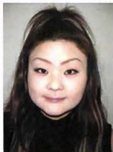
澤田 知子 (写真家)