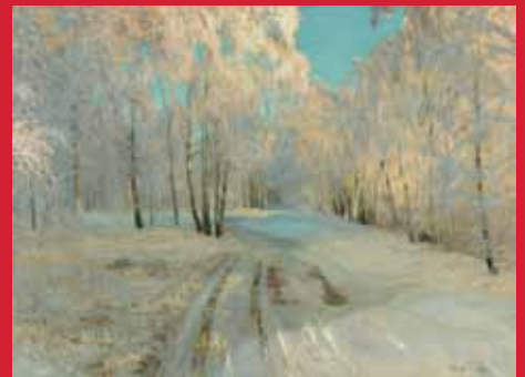
ワシーリー・バクシェーエフ《樹》1900年 油彩・キャンヴァス