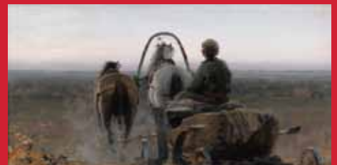
アブラム・アルヒーポフ《帰り道》1896年 油彩・キャンヴァス ©The State Tretyakov Gallery

モ スクワにある国立トレチャコフ美術館は、創設者パーヴェル・トレチャコフ(1832-1898)によってその基礎が築かれた約20万点のコレクションを有するロシア美術の殿堂です。なかでも19世紀後半から20世紀初頭にかけてロシア各地で移動展覧会を行なった「移動派」のクラムスコイやシーシキン、レーピンといったロシア近代絵画の巨匠たちの作品を豊富に所蔵していることで世界的に有名です。