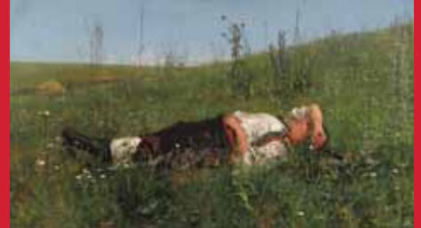
ニコライ・クズネツォフ《祝日》1879年 油彩・キャンヴァス