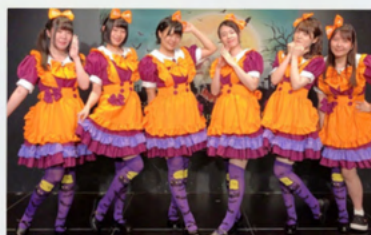
アイドル活動を行う子も