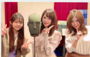
在学中に収録のお仕事

美声ラボは、現場での経験を積みながら成長できるスクールです。さまざまなレッスンや、ゲスト講師による特別講習をはじめ、生徒にもレベルに合わせたオファーを用意しています。レッスンを受けながらもプロの現場を経験するチャンスが多いことが特長です。