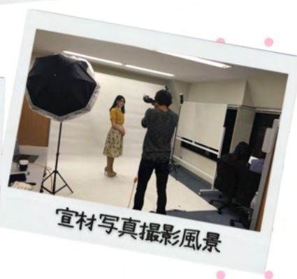
宣材写真撮影風景