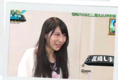
在学中にお仕事も