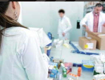
メディカル/ヘルスケア