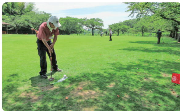
グラウンド・ゴルフ大会