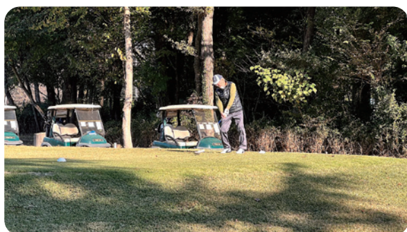
チャレンジゴルフ大会