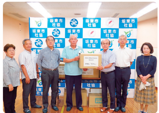
茨城県退職公務員連盟坂東支部