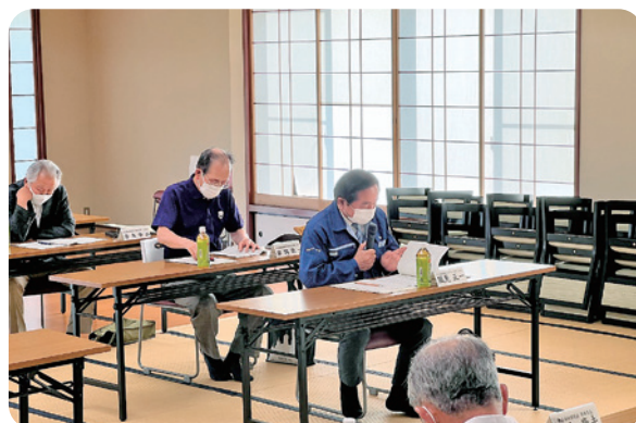
各支部長 意見交換会