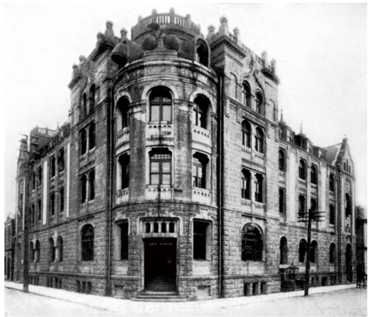
1902年10月8日に横浜山下町74に開設された横浜支店

1999年に那覇で業務を開始して以来、シティは沖縄で事業を展開しており、現在、オペレーションやテクノロジーなどの金融業務の一部を沖縄で行っています。現地での採用の強化などを通じて、今後も業容を拡充します。