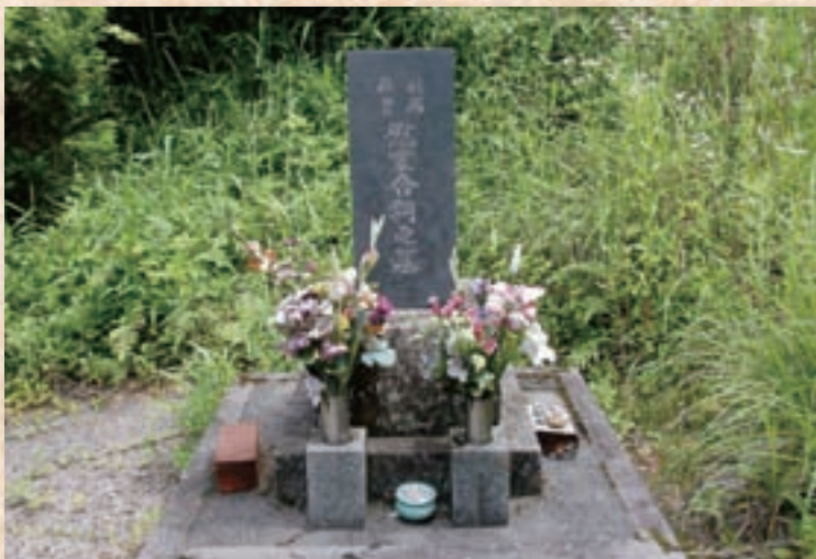
吉田温泉北側にある戦病死者慰霊合祠之墓