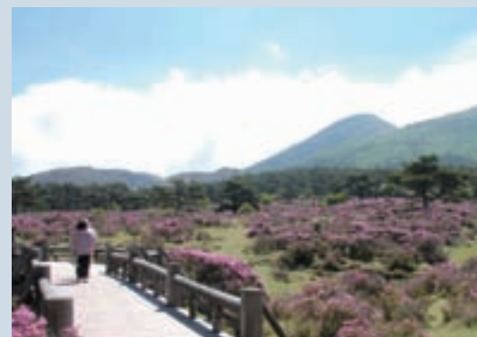
つつじヶ丘はすばらしい光景でした

えびの高原のミヤマキリシマが6月上旬見ごろとなりました。 今年は、例年よりミヤマキリシマの花付きが良く、県内外から多くの見物客でにぎわいました。 ミヤマキリシマの咲くこの時期は、つつじヶ丘やハイキングコースなどは、まるでジュウタンを敷きつめたようなすばらしい光景となります。 ミヤマキリシマの開花時期は、標高や場所によって変わります。つつじヶ丘周辺の見ごろが終わると、徐々に高い場所が開花します。韓国岳でも見ることもできます。