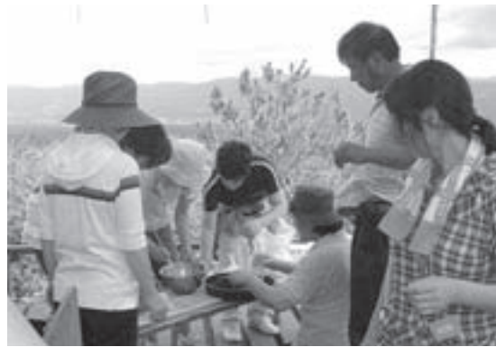
親子ふれあいファミリー会の様子