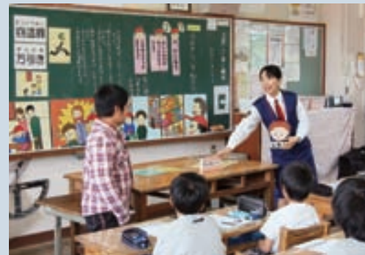
指導員と劇の中で受け答えをする児童

5月12日、飯野小学校の4年生79人が、非行防止教室の授業を受けました。 授業にあたったのは、都城地区少年サポートセンター少年指導職員2人と担任の先生。「万引きについて知ろう・こんな時どうする」という内容で、劇をまじえながら授業を行いました。 劇では、児童も参加しました。劇で児童たちは、真剣に受け答えをしていました。 授業に参加した児童は、「万引きは犯罪であり悪いことだとよく分かりました」と話していました。