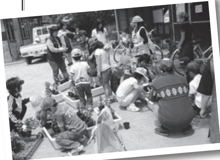
大人と子どもの交流活動事業花植え

田代地区は、山すそ沿いの8分区・90戸約300人が居住している農業が盛んな地区です。地区の主な行事は、大人と子どもの交流活動事業として年2回の花苗の植栽（5月にサルビア、11月にパンジー）を行っています。