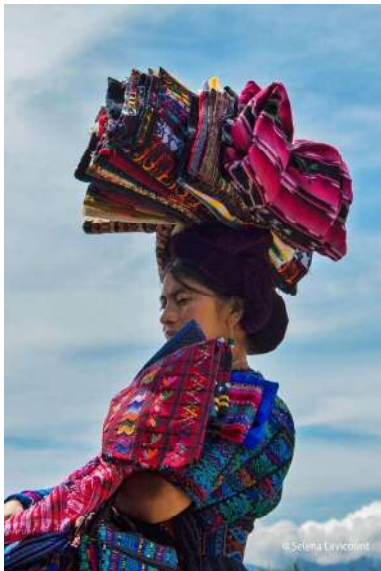
布を運ぶマヤ系住民