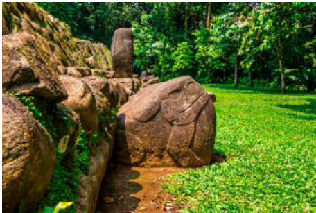
レタウレウ県のタカリク・アバフ遺跡の カエルのモニュメント

マヤ文明遺跡は中米各地に様々ありますが、最大と言われているのがユネスコ世界複合遺産にもなっているグアテマラの「ティカル国立公園」内の遺跡です。