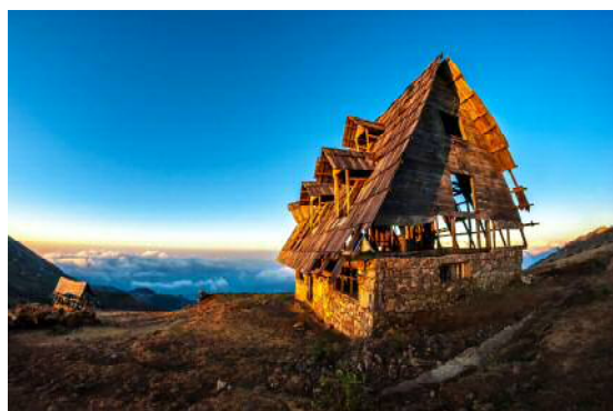
ウエウエテナンゴ県の展望台

Hola! (オラ) は「こんにちは」、 AMIGO (アミーゴ) は「友達」だワン。