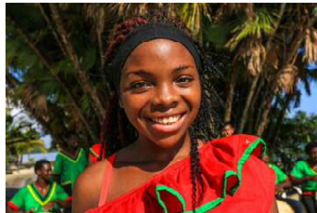
カリブ海側に住むガリフナ系の住民