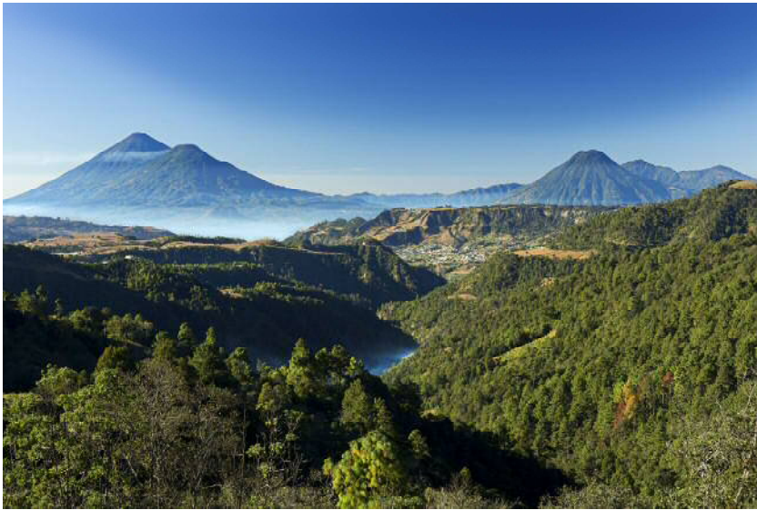
ソロラ県の湖、谷、山がある風景