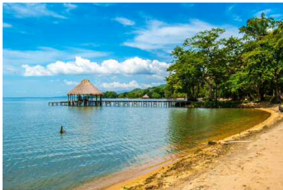
イザバル県のプラジャ・ドラダ