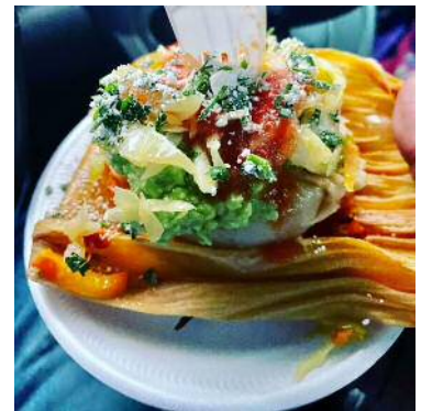
写真のように様々なトッピングをして食べることが多い