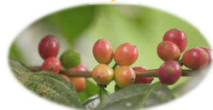
少し熟したコーヒーの実