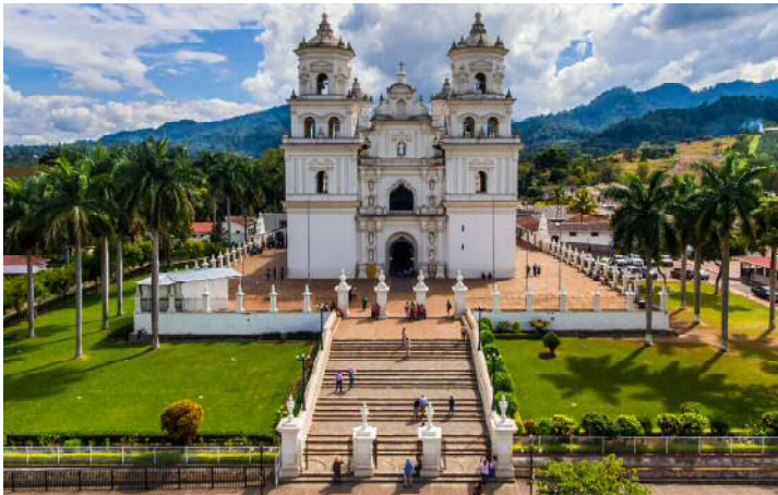
エスキブラス大聖堂