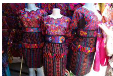
伝統衣装の販売店

全人口の4割以上がマヤ文明を起源に持つ国民であり、そのほかが欧州系の祖先をもつ国民で構成されています。公用語はスペイン語ですが、そのほかにも22のマヤ系言語も話されており、多民族で豊かな先住民文化が残る国です。特に、マヤ系民族衣装は地域によって色と柄が異なり、街中では色鮮やかなウィピル(上衣)やコルテ(スカートになる布)を纏い生活している女性が見られます。