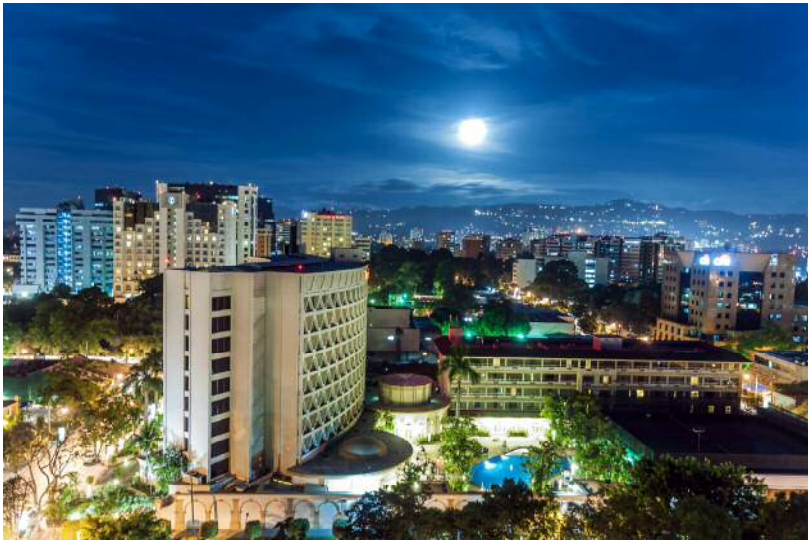
首都グアテマラシティの夜景