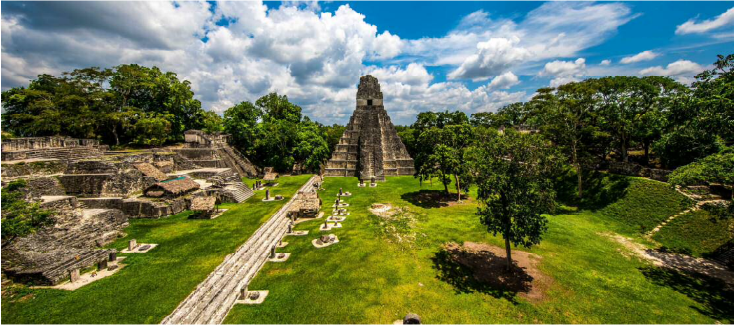
パテン県にあるユネスコ世界複合遺産「ティカル国立公園」