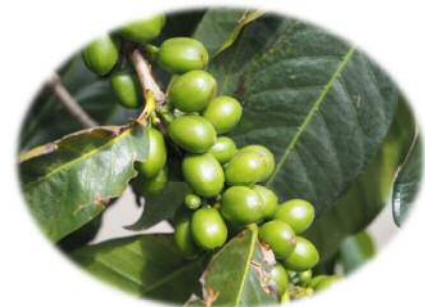
未熟なコーヒーの実