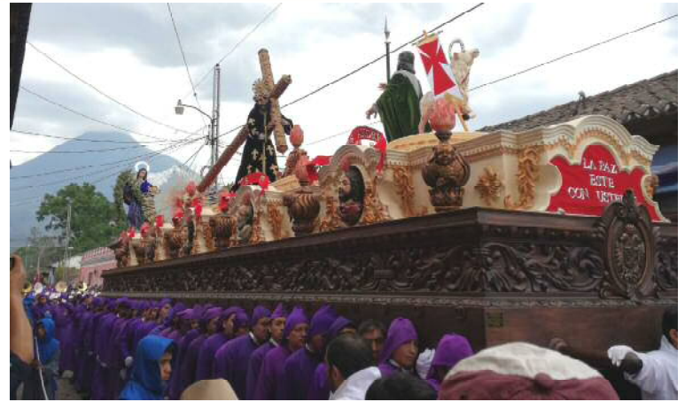
キリスト像をのせた山車