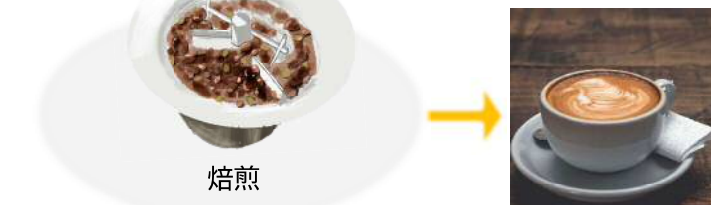
グアテマラコーヒー

グアテマラは国土の約70%が山岳地帯で、火山活動による火山灰地が多数あります。火山灰地はミネラルが豊富で、植物も根を伸ばしやすく、コーヒーに適した土地の一つとされています。また、山岳地では朝晩の寒暖差が大きく、その寒暖差がコーヒーの酸味と甘みを高くすることにつながります。そのためグアテマラは国土は小さいながらも世界でも有数のコーヒー生産地とされています。