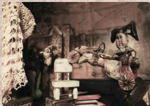
No.2110(進化)、《子供の頃分》(2017)小道具、No.1004(水色のボールの馬)