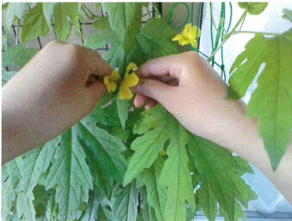
雌花（花芯が黄緑色） 雄花（花芯が山吹色）