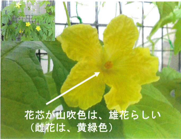
花芯が山吹色は、雄花らしい （雌花は、黄緑色）