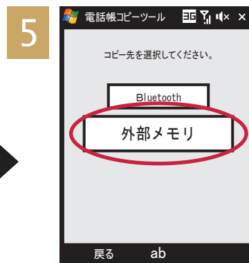
[外部メモリ] をタッチ