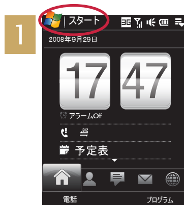
[スタート] をタッチ