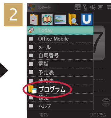
[プログラム] をタッチ