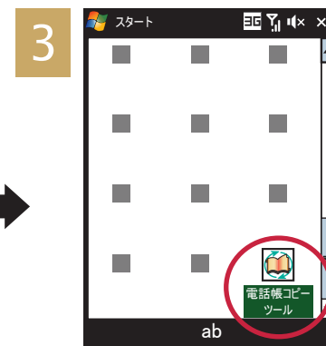
[電話帳コピーツール] をタッチ