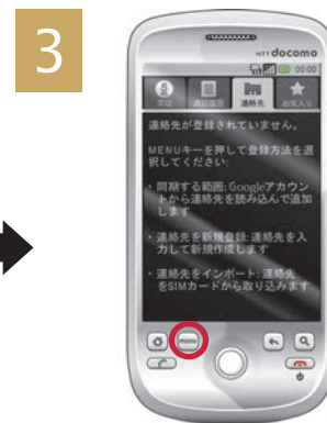
メニューボタンを押す