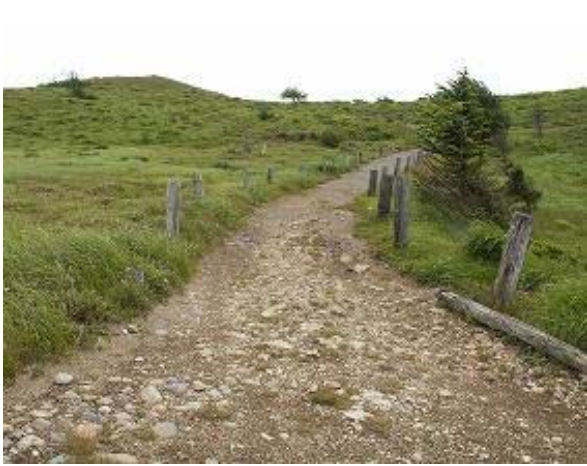
鉢伏山線 鉢伏山山頂