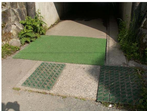
八島ヶ原湿原 靴底付着物除去マット