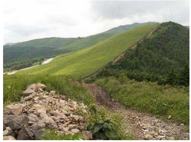
北の耳南の耳線 大門峠