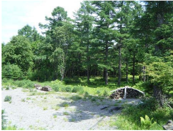
千駄刈 野営場 予定地