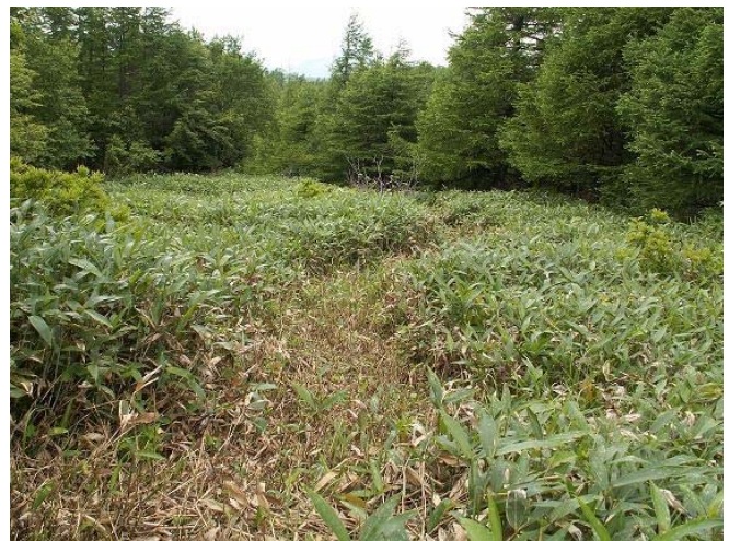
浅間武石峠線 思い出の丘