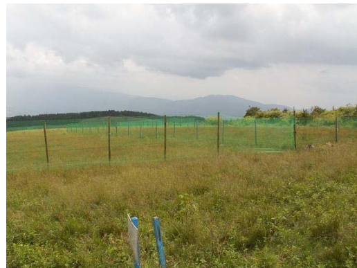
霧ヶ峰蛙原 植生再生区画