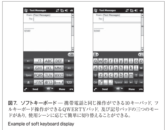
図7. ソフトキーボード—携帯電話と同じ操作ができる10キーパッド、フルキーボード操作ができるQWERTYパッド、及び記号パッドの三つのモードがあり、使用シーンに応じて簡単に切り替えることができる。

4.4.5 モーションセンサ機能 筐体を縦から横又は横から縦に動かすこと(Rotate)による画面の縦横切替え、傾き操作(Tilt)によるブラウザ画面のページ送りやストライプメ