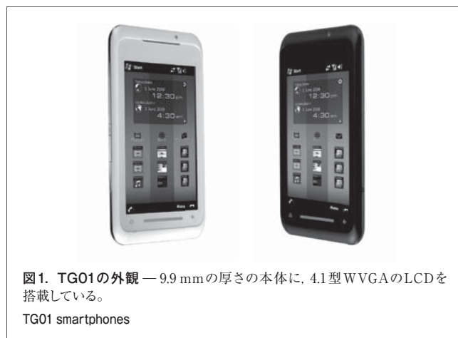
図1. TG01の外観 — 9.9 mmの厚さの本体に、4.1型WVGAのLCDを搭載している。

TG01の外観を図1に示す。高精細で大画面の4.1型WVGA LCDにタッチパネルを採用し、タッチパネル下部には中央にズームバー、左にホームキー、右にバックキーを配置している。また、左側面に電源キーとボリュームキー、右側面にカメラキーを配置している。大型タッチパネルLCDと東芝独自の