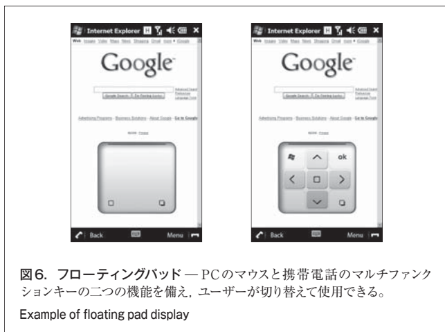
図6. フローティングパッド—PCのマウスと携帯電話のマルチファンクションキーの二つの機能を備え、ユーザーが切り替えて使用できる。 Example of floating pad display

4.4.3 フローティングパッド 片手で操作できるように、フローティングパッドを搭載した。フローティングパッドとは、PCのマウスと携帯電話のマルチファンクションキーの二つの機能を備え、ユーザーが切り替えて使い分けすることができる。フローティングパッドは、簡単な操作でいつでも表示でき、また、画面上の任意の場所に移動したり、使い終わったときに簡単な操作で消すことができる。このパッドを使うことで、例えば画面上部にあるスタートメニューを片手で操作することができる(図6)。