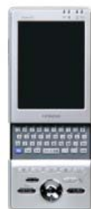
スライド式キーボード