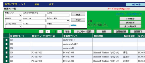
運用管理支援ポータル（サービスポータル）画面

*1 運用管理支援ポータルが利用可能なメニューについては弊社担当営業にお問い合わせください。