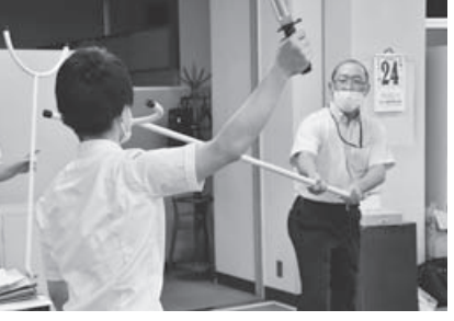
さすまたを用いた実技指導

商工会議所に不審者が侵入した際の対応方法を学ぶため、岩見沢警察署生活安全課からお二人を招き防犯訓練を実施しました。訓練では、心構えとして①落ち着いて対応する、②複数人で対応する、③110通報をする人を予め決めておく、④早めの110番通報をするなどの話があり、さすまたを利用した実技指導もしていただきました。また、ガソリンなどをまかれた際には、躊躇せず逃げたほうが良いため、日頃から避難経路の確認をすることなどアドバイスをいただきました。