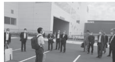
DPL札幌レールゲート前にて撮影