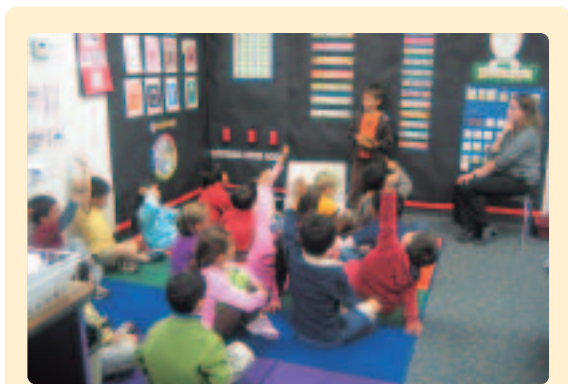
〈Show and Tellの風景〉小学校低学年から人前に立って話す訓練。クラスの皆に紹介したい物を持ってきて5分程度で説明をする。

英語での発言が十分にできるようになるまでの間、家庭では日本語でニュースやテレビ番組を見て感じたこと、思ったことを話させたり、社会情勢について親子で意見を交換するという練習をさせましょう。「考えをまとめ、述べる力」を養っておくことで、日本語ではもちろんのこと、英語力が身につけてきた折には英語でも考えを述べるのがよりスムーズにできるようになります。