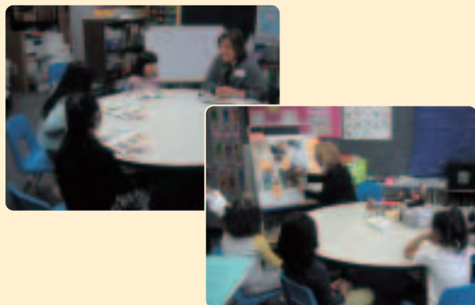
〈Pull-out式〉在籍するクラスの授業中に2~3人別室で集中的に英語を学習する。

※2 現地校入学用に「海外子女教育手帳」を販売しています。詳しくは裏表紙をご参照ください。