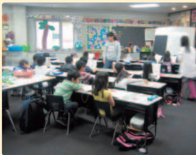
〈補習授業校の授業風景〉

※補習授業校…日本の教科書を使って国語、算数（数学）をはじめとする日本の教科を学習します。また、学習だけでなく、日本の学校習慣、生活習慣なども指導し、日本の学校文化に触れる機会をなるべく多く設けようと努力している学校も数多くあります。