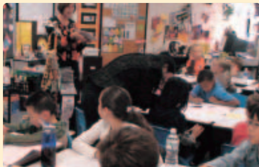
〈Push-in式〉在籍するクラスの中で授業を受けながら、必要に応じて何らかの言語サポートが提供される。