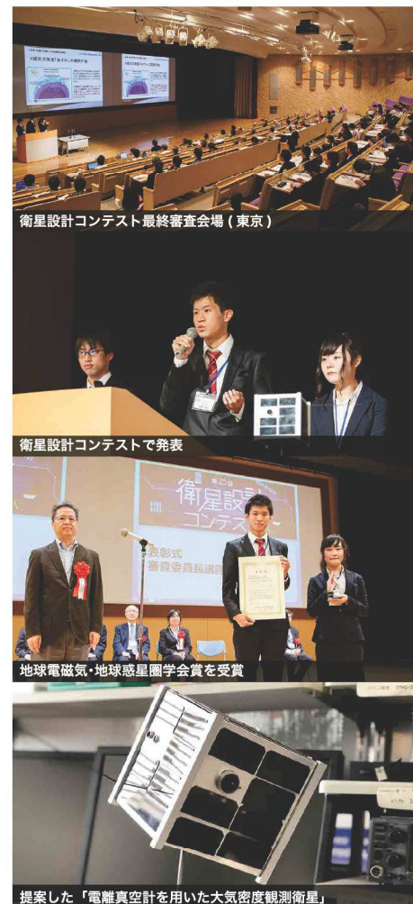
衛星設計コンテスト最終審査会場(東京)