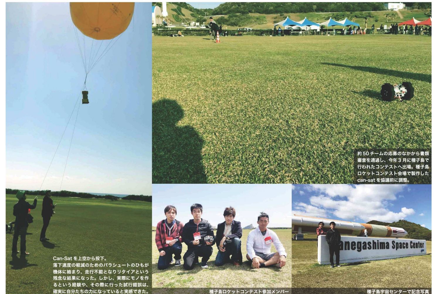
約50チームの応募のなかから書類審査を通過し、今年3月に種子島で行われたコンテストへ出場。種子島ロケットコンテスト会場で作ったcan-satを協議前に調整。