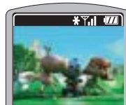
X02HTでのコンテンツ再生イメージ

さらには、アニメ制作支援事業でもモバイルの有効活用を計画している。同社は複数の場所で手書きされる膨大なアニメ原画の情報整理と進捗管理を自動化するツールを作成しているが、この仕組みをモバイルにも対応させたいとのことだ。