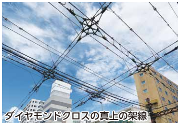
ダイヤモンドクロスの真上の架線