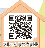
マルっとまつやまHP