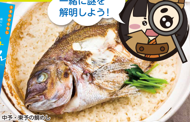
中予・東予の鯛めし

瀬戸内海に面した松山は、新鮮な水産物が水揚げされ、特に「鯛」「たこ」「あなご」はその中でも絶品です。それらを使って作ったごはん料理の「鯛めし」「たこめし」「あなごめし」の味は格別で、瀬戸の松山ならではのちそうです。そして、これらを代表とするごはん料理を「瀬戸のまつやま・海ごはん」といいます。「海ごはん」は松山の地元ならではの料理です。松山の味を是非、ご賞味ください。