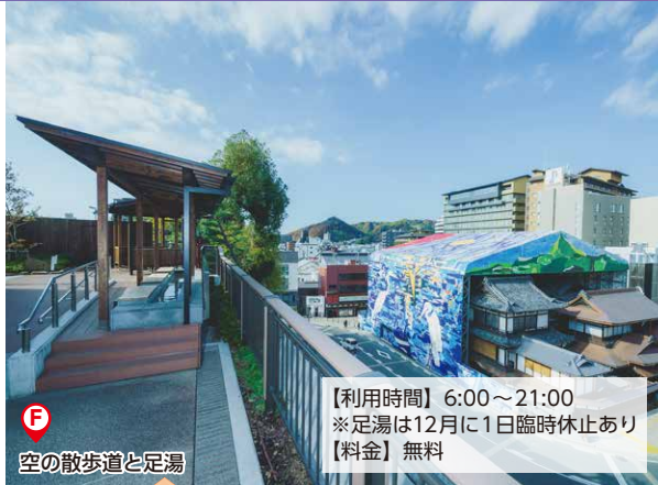
空の散歩道と足湯