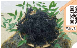
松山ひじき 旬:通年

松山の温暖な気候を活かして生産されているアボカド。旬が異なる4品種ごとの形や味の違いをお楽しみください。