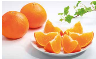
紅まどんな 旬:11月下旬~12月下旬

ゼリーのような食感の柑橘で、甘い香りと果汁が多いのが特長です。皮が薄いので、カットフルーツでお召し上がりください。