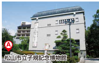
松山市立子規記念博物館