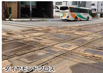
ダイヤモンドクロス

伊予鉄道郊外電車高浜線・大手町駅前には、全国的にも珍しい軌道（市内電車）と鉄道（郊外電車）が平面交差する、通称「ダイヤモンドクロス」という場所があります。市内電車は自動車と同じく信号待ちをして、郊外電車の通過を待ちます。この「電車が踏切待ちする姿」が全国でもここだけということで鉄道マニアや観光客の間で話題になっています。運が良ければ、坊っちゃん列車が電車待ちする光景も見られます。