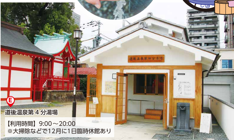
道後温泉第4分湯場