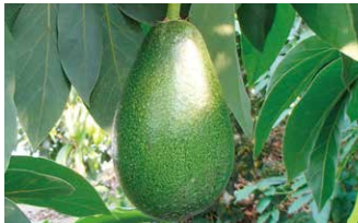
松山アボカド 旬:10月下旬~3月上旬

ゼリーのような食感の柑橘で、甘い香りと果汁が多いのが特長です。皮が薄いので、カットフルーツでお召し上がりください。