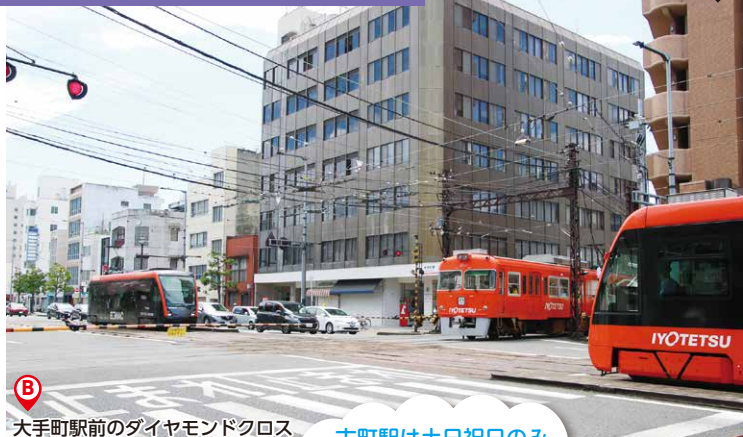
大手町駅前のダイヤモンドクロス

古町駅は土日祝日のみ、坊っちゃん列車が1日1便だけ停車するんよ〜 激レアやけん〜