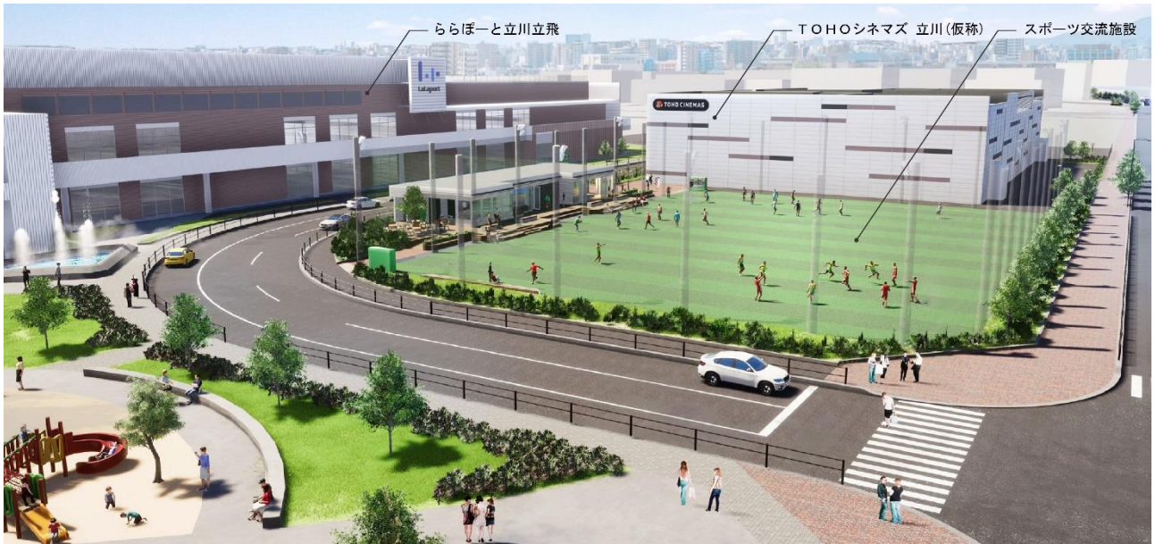
多摩モノレール「立飛」駅からのイメージ