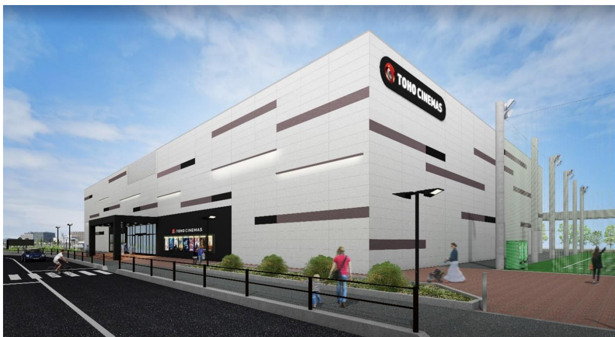
「TOHOシネマズ 立川(仮称)」外観イメージ

「TOHOシネマズ 立川(仮称)」計画地近接の「ららぽーと立川立飛」は、JR中央線「立川」駅から多摩モノレール線で2駅の「立飛」駅と接続ブリッジで直結された立川市最大級の大型商業施設です。2015年12月開業以降、仲間や家族と集い楽しむ空間の提供や、お客さまひとりひとりがリラックスしながらくつろぐことができる環境の整備など、多様なニーズに応えられるよう、ショッピングやお食事だけでなく、多彩なサービスの提供やイベントを実施してまいりました。今後も常に新しい付加価値やサービスを発信・提供しながら、お客さまにさらにご支持いただける施設を目指し、進化し続けてまいります。