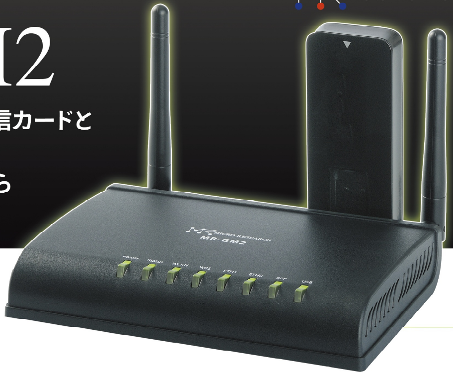
※本製品にUSBモバイルデータ通信カードは付属していません。

USB対応のモバイルデータ通信カードと MR-GM2を利用すれば どこでも簡単に複数の端末から インターネット接続できます。