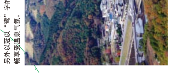
从大山看了汤乡温泉的景色

别名为汤乡的汤乡温泉，据说过去是宫本武藏在化身为白鹿的文殊菩萨的带领下发现了此泉，所以得名。汤乡温泉有着高15米宽27米的大喷泉，在夜间灯光照射下看到如像白鹿开翅膀飞翔的景象，新趣之至能享受和风，另外还可以以“汤”字的各种料理和露天温泉。