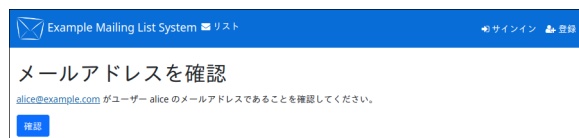
図 2 メールアドレスの確認画面

表題 ( Subject: ) が [ <サイト名> メールアドレスを確認してください ] の確認メールが届くまで待ち、メール内の URL を Web ブラウザで開くとメールアドレスの確認画面が表示されます。この画面の「確認」ボタンを押すとログインできるようになります。