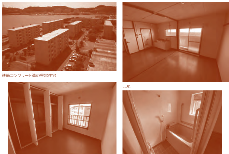
※間取り図や写真は代表的なものを示していますので、住宅により状況が異なります。

お申し込みの際は、各地区(住宅)のあき状況を(一社)かながわ土地建物保全協会 入居者募集担当にご確認のうえ、お申込下さい。