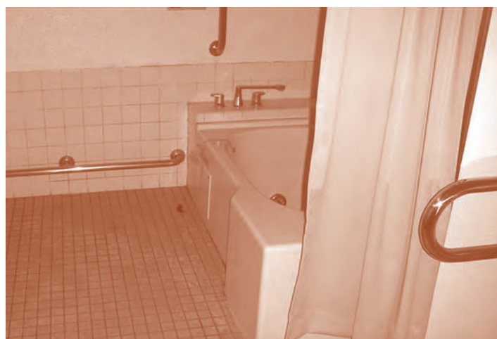
※住宅によって一部異なります。