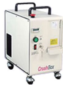
HDD自動物理破壊装置 Crush Box

専用機でハードディスクの記録部分のみをピンポイントで加圧変形させ、記録磁性層を破壊し、穴を開けます。