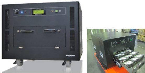
磁気データ消去装置MagWiper MW-30000X

強い電磁場を生じさせる最新機械を使用し、残留磁気を一定の方向に変えデータを消滅させます。最新のHDD（垂直磁気記録方式）も瞬時に完全データ消去いたします。