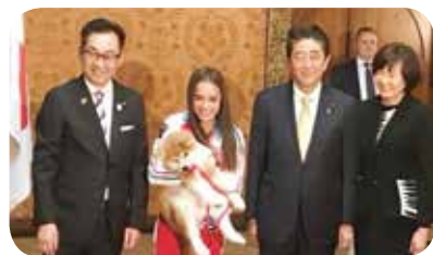
▲秋田犬贈呈式（モスクワ）