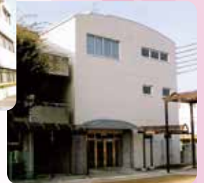
1998年(平成10年) 7号館(クラブ練習室など)完成