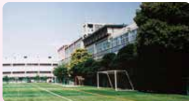
2008年(平成20年) 大阪産業大学附属高等学校