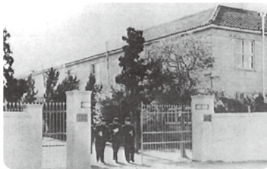
1950年(昭和25年) 大阪鉄道中・高等学校