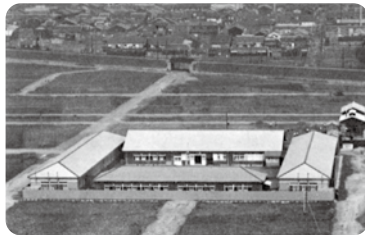
1937年(昭和12年) 野江校舎全景