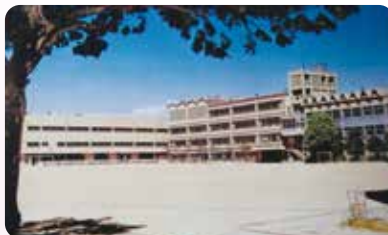
1983年(昭和58年) 大阪産業大学高等学校