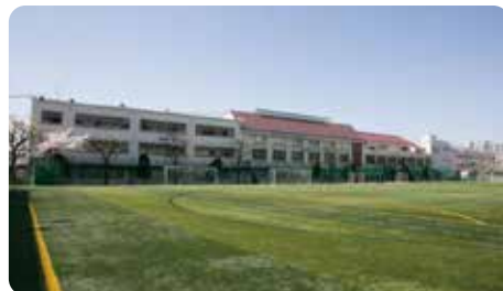
2017年(平成29年) 大阪産業大学附属中学・高等学校