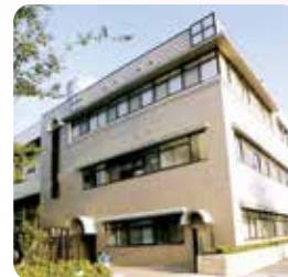
1998年(平成10年) 食堂完成