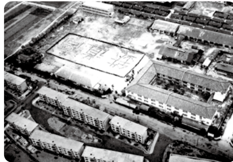
1957年(昭和32年) 古市校舎全景