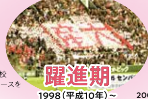
躍進期 1998(平成10年)~2018(平成30年)

1964年(昭和39年) 大阪鉄道高等学校・普通科募集 1963年(昭和38年) 大阪鉄道中学校・募集中止 1966年(昭和41年) ・大阪産業大学短期大学部 設立 ・自動車工業科増設 1965年(昭和40年) ・大阪交通学園設立 ・経営学部経営学科・工学部機械工学科・交通機械工学科(1.2部)開設 ・大阪交通大学を 大阪産業大学と改称 1964年(昭和39年) 大阪鉄道高等学校・普通科募集 1963年(昭和38年) 大阪鉄道中学校・募集中止 1998年(平成10年)4月 大阪産業大学附属高等学校 ・普通科を特進文系・理系コースを総合文系・理系コースに再編 ・国際科コンピューターコースを国際情報コースに名称変更 2001年(平成13年) ・大阪産業大学附属 高等学校 工業科廃止 ・大阪産業大学附属 中学校 設置認可 2003年(平成15年) 大阪産業大学附属高等学校 ・普通科総合文系・理系コースを 進学文系・理系コースに ・大国際インターナショナルコースを 特進英語コースに ・大国際情報コースを英語進学コースに改編 2004年(平成16年) 大阪産業大学附属高等学校 ・普通科を特進一貫 特進II・進学、スポーツコースに再編