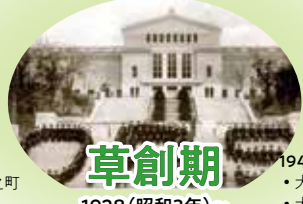
草創期 1928(昭和3年)~1948(昭和23年)

1928年(昭和3年) ・大阪鉄道学校創立 ・大阪市北区兎我町授業開始(業務科設置・電気科・建築科・機械科設置:入学生190名) 1948年(昭和23年) ・大阪第一高等学校設立(普通・業務・機械・土木・電気) ・創立20周年記念式典 1947年(昭和22年) 大阪第一中学校設立 1946年(昭和21年) ・滝井国民学校(立退き) ・高殿国民学校(移転) ・高殿国民学校(立退き) ・大正国民学校(移転) ・旧軍事施設造兵廠宿舎跡を借り授業開始 ・大阪市城東区古市中通り(現高校所在地) 1945年(昭和20年) ・大阪鉄道学校(3年制廃止) ・大阪第一鉄道学校へ合併 ・大空襲により全校舎焼失 ・守口市滝井国民学校を借り授業開始 1944年(昭和19年) ・財団法人「大阪鉄道学校」設立 ・本館及び北館焼失