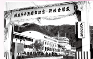
1961年(昭和36年) 大阪交通学園