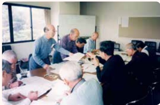
▲学校の海の家「静雲荘」編集会議の様子