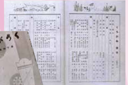
1941年(昭和16年) 大阪鉄道学校校友会「くろがね14号」 表紙と目次