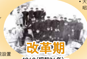
改革期 1949(昭和24年)~1968(昭和43年)

1949年(昭和24年12月)改称 大阪鉄道高等学校・中学校 1950年(昭和25年) ・大阪交通短期大学設立 ・通信教育部設置(1年間) 1951年(昭和26年) 学校法人大阪交通学園 1952年(昭和27年) 学校校舎1,600坪拡張 1955年(昭和30年) 大阪鉄道高等学校 商業科 増設 1961年(昭和36年) 大阪自動車工業専門学院設置 大東学舎第1号落成 1962年(昭和37年) ・大阪交通短期大学 自動車工業科(1.2部)増設 ・大東市中垣内・新校舎で授業開始 ・大阪交通短期大学 機械科・交通経営科各1部増設 1998年(平成10年)4月 大阪産業大学附属高等学校 ・普通科を特進文系・理系コースを総合文系・理系コースに再編 ・国際科コンピューターコースを国際情報コースに名称変更 2001年(平成13年) ・大阪産業大学附属 高等学校 工業科廃止 ・大阪産業大学附属 中学校 設置認可 2003年(平成15年) 大阪産業大学附属高等学校 ・普通科総合文系・理系コースを 進学文系・理系コースに ・大国際インターナショナルコースを 特進英語コースに ・大国際情報コースを英語進学コースに改編 2004年(平成16年) 大阪産業大学附属高等学校 ・普通科を特進一貫 特進II・進学、スポーツコースに再編