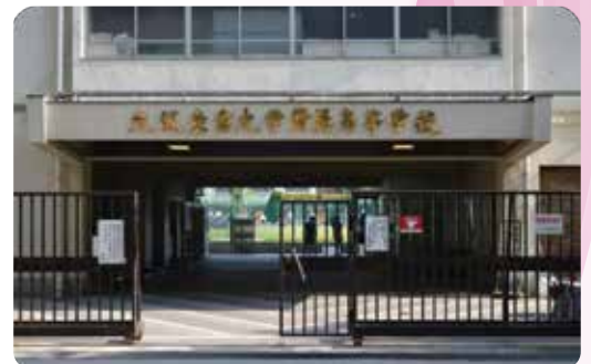
2020年(令和2年) 大阪産業大学附属高等学校