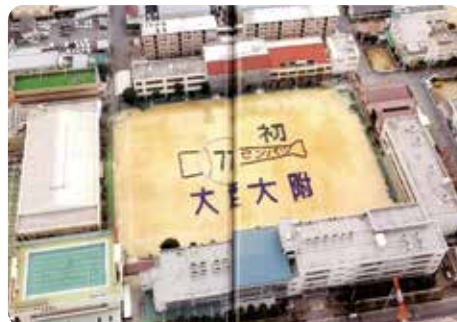
2005年(平成17年) 校舎全景