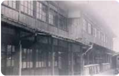
1928年(昭和3年) 兔我野町校舎