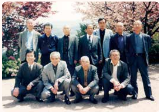
▲学校の海の家「静雲荘」編集会議・参加者全員

来年こそはコロナ禍が明け、皆様とお会いできる同窓会総会を催したいと祈願しています。