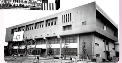
1965年(昭和40年) 高等学校体育館