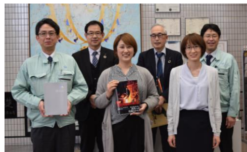
若手の女性社員が中心となって撮影対応を進めた