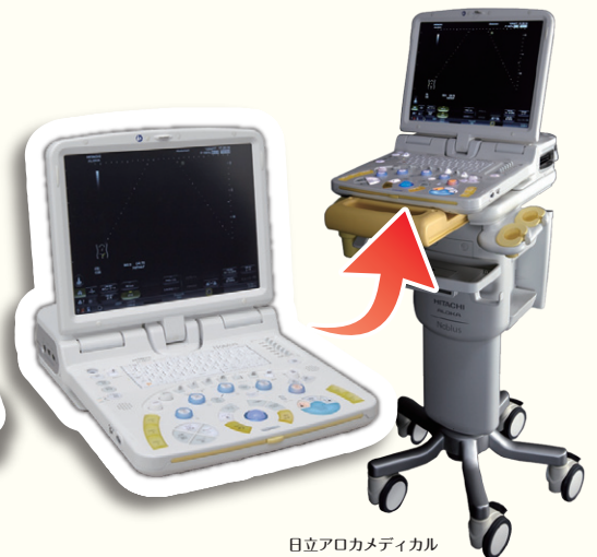
日立アロカメディカル Noblus 医療機器認証番号 第 224ABBZX00092000 号