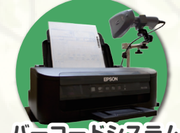
バーコードシステム

使い勝手の良い操作性はもちろん、療養費改正等の保険改正にすばやく対応。 迅速サポートでご好評を頂いている『三四郎くん』は、常に進化を続ける信頼と実績の事務管理ソフトです。