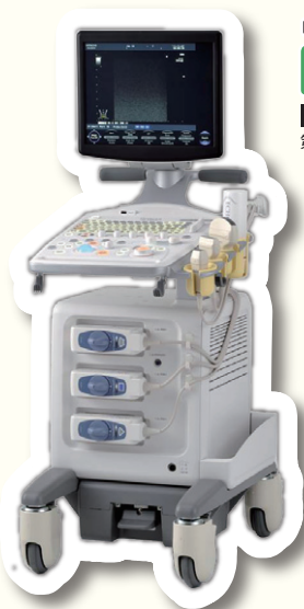
日立アロカメディカル F37 医療機器認証番号 第 223AABZX00150000 号