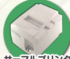
サーマルプリンタ