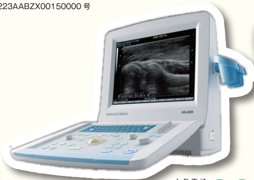
本多電子 HS-2200 医療機器認証番号 第 225AHBZX00034 号