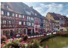
フランス・アルザス地方