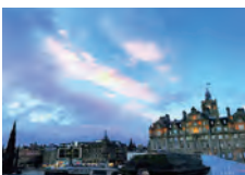
イギリス・エディンバラ