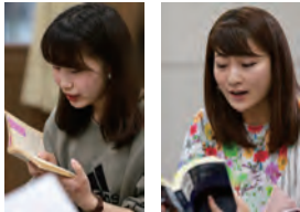
令和元年(2019)7月朗読会 声でつむぐ辻文学《廻廊にて》の様子