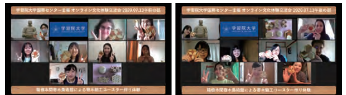
作成したコースターを持って記念撮影

本学では年2回留学生バス旅行を開催し、留学生の皆さんに、日本の文化や自然に触れる機会を提供しています。令和2(2020)年度は、新型コロナウイルス感染症蔓延防止のため、バス旅行の開催が中止されました。そのため、国際センターでは、7月13日(月)に箱根にある寄木細工のコレクションで著名な「本間寄木美術館」のご協力の下、職人の方と留学生や国際センターボランティアの学生の自宅をつなぎ、遠隔で寄木細工の体験を行いました。各自が美しい寄木細工の模様のコースターを作成し、日本文化に触れたひと時を過ごしました。