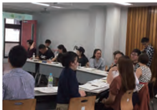
昨年度の様子(わくわくクラス)