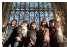
イギリス・ヨーク