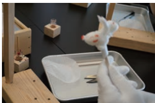
7/2 鉛細工体験@西日暮里