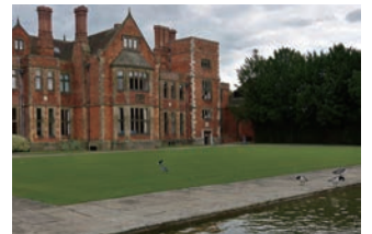
イギリス・ヨーク