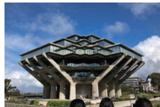
アメリカ・サンディエゴ