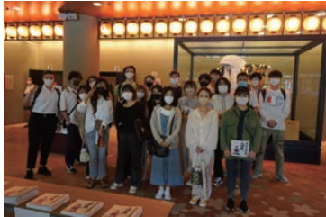
歌舞伎鑑賞教室@国立劇場

本学では、一般社団法人霞会館のご助成のもと、定期的に伝統芸能の鑑賞会を開催し、留学生の皆さんに、日本古来の伝統芸能や文化に触れる機会を提供しています。今年度は、新型コロナウイルス感染症蔓延防止の対策が取られた国立劇場にて、6月18日(土)に歌舞伎鑑賞教室を開催いたしました。留学生20名と高等科生5名の計25名が参加しました。