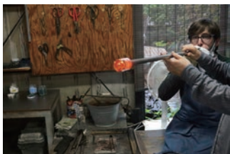
5/21 吹きガラス体験@川越

西日暮里駅に近い鉛細工工房で、職人から鉛細工の歴史の説明を受け、鉛細工体験をしました。「うさぎ」の製作工程の説明を受け、熱い鉛をスピーディに仕上げなければならず、悪戦苦闘しながら作製していました。なかにはユニークなうさぎも出来上がりましたが、みな満足そうでした。その後は、谷根千を散策しながら、上野恩賜公園に向かい、上野東照宮を参拝しました。とても暑い日でしたが、木陰で休みながら、留学生同士も親交を深め、日本の文化にも触れるとても良い機会となりました。