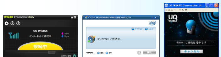
ユーティリティ（例）

<注意> UD01SS、UD01NA、UD01OK、UD02NA、UD02SSをご購入のお客様につきましては 自動で再接続されませんので、ご自身で切断・再接続を行ってください。