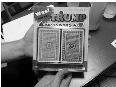
図9. トランプはもちろん新品のものを用意しました。