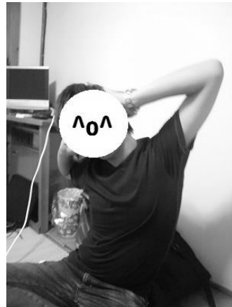
図6. 苦悶の表情を浮かべる西脇くん