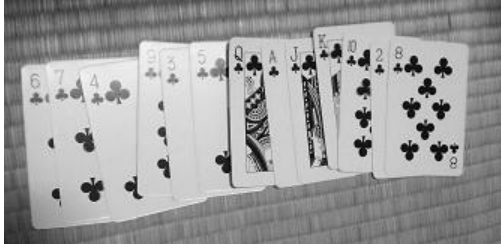
図5. ダメだったトランプ