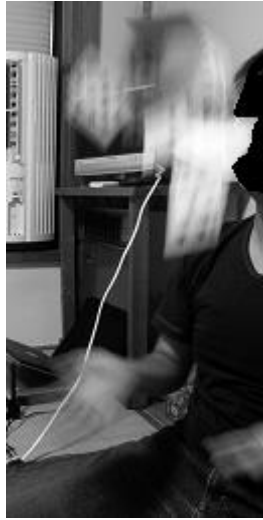
図 2. 宙に舞うトランプ