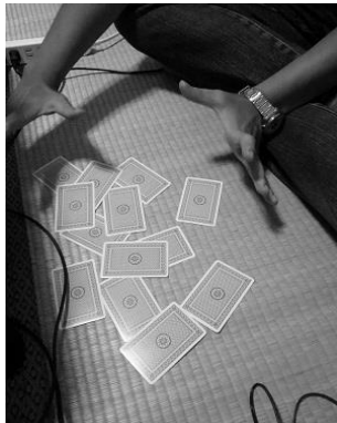
図 3. 地に堕ちたトランプ