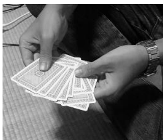
図 1. 13 枚のトランプ

ボゴソートのアルゴリズムは単純です。例えばトランプの 1 スートをソートする場合、