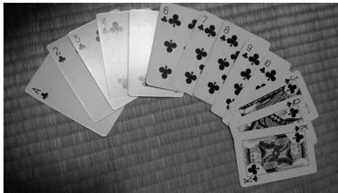
図7. 成功したトランプ