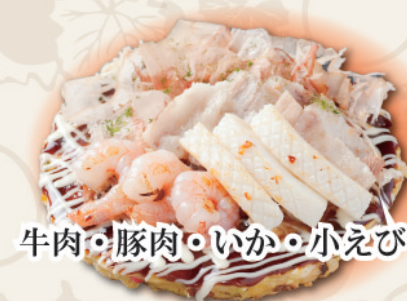
牛肉・豚肉・いか・小えび