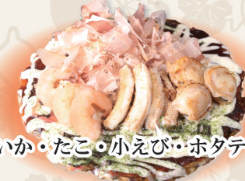
いか・たこ・小えび・ホタテ