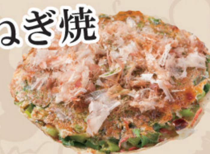
(青ねぎ・素干小えび入り)

薄く広げた生地に青ねぎをどっさりとのせ、ゆっくりと焼き上げる事でねぎの甘みを引き出します。