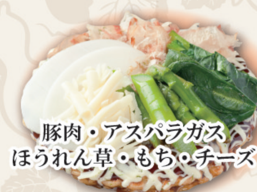
豚肉・アスパラガス ほうれん草・もち・チーズ