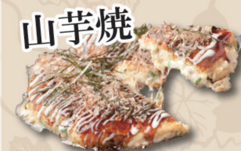
(長芋・大和芋・塩昆布・大葉入り)

2種類の山芋を贅沢に使用しほとんどが山芋と玉子で出来た生地はふわふわトロトロの優しい食感です