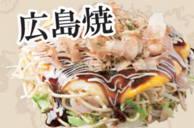
(もやし・キャベツ・そば麺入り)

生地を薄く広げて千切りキャベツをたっぷりとのせもやしや具材などを重ねて焼くのが広島風。蒸し焼きでキャベツの甘みを引き出します。