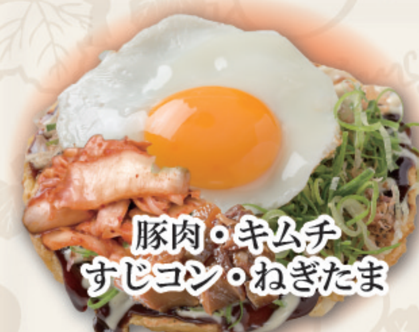
豚肉・キムチ すじコン・ねぎたま