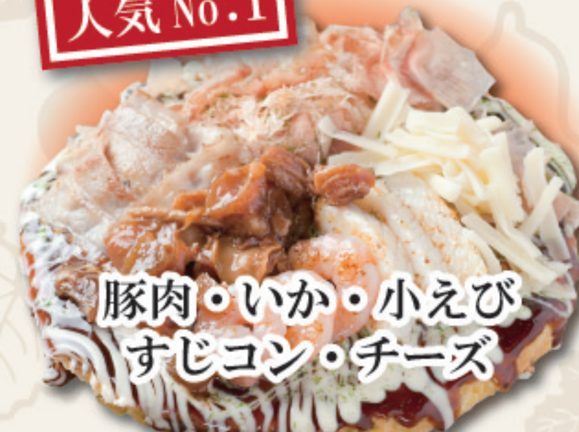
豚肉・いか・小えび すじコン・チーズ