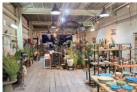
写真:かまーとの森

家庭・仕事・人付き合いなど、どれも大切にバランスよく、濃く、効率よく生活して、目標に行き着きたいものです。この本はその道中に不可欠な参考書であり、力強い味方ともいえます。